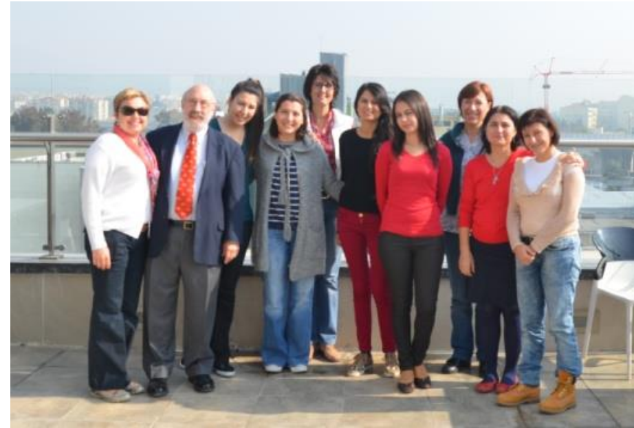
Yaşar University Continuing Education Center (YUCEC)