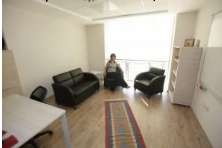
Yaşar University Continuing Education Center (YUCEC)