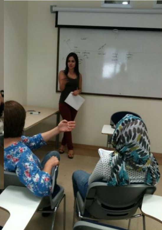
Yaşar University Continuing Education Center (YUCEC)